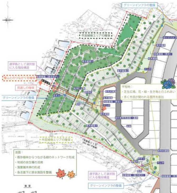
(第2回 榎山周辺の緑地整備計画平面図)

今後は公園の整備方針について説明会の開催を予定しておりますので、ご参加ください。