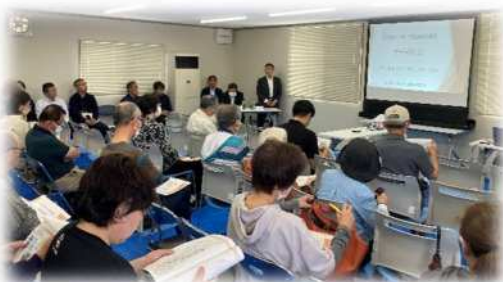
(住民説明会の様子)