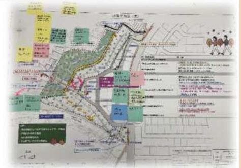
(緑地説明会の様子)