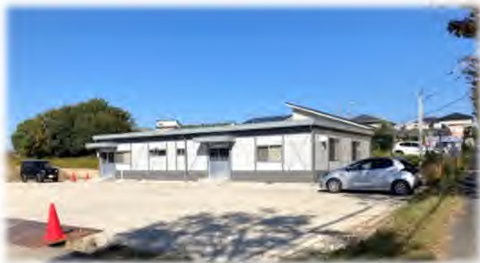
届け出先【組合事務所】

事業に対してご不明な点等がございましたら、組合事務所にお気軽にお立ち寄りください。