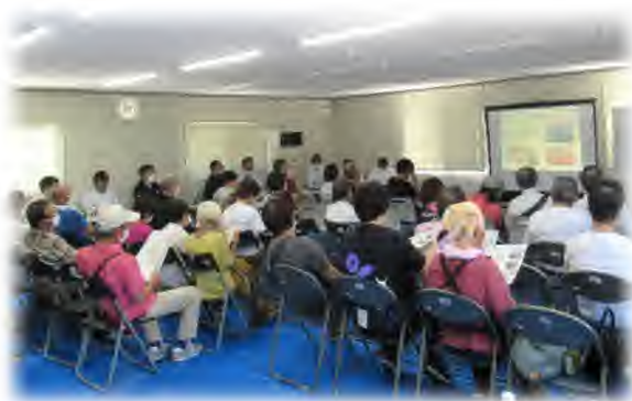
（6月16日 工事説明会の様子）